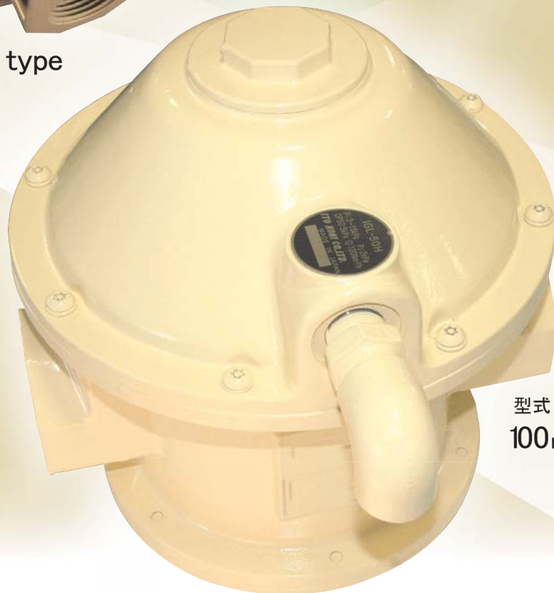
型式 : IGL-50H-F 100m 3 /h(normal) type