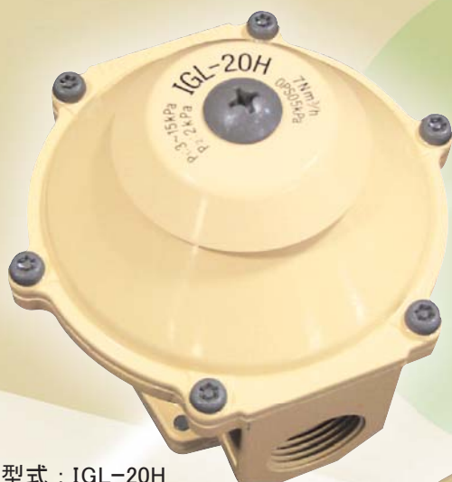
型式 : IGL-20H 7m 3 /h(normal) type