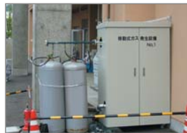
新潟中越沖地震 老人福祉施設