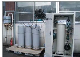
新潟中越沖地震 救急指定病院(GHP)