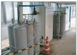
新潟中越沖地震 救急指定病院(厨房)