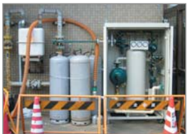
新潟中越沖地震 老人福祉施設