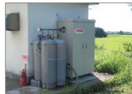
新潟中越沖地震 避難場所(中学校)