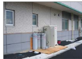
新潟中越沖地震 老人福祉施設