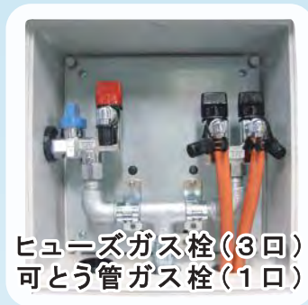
ヒューズガス栓(3口) 可とう管ガス栓(1口)

既設の設備に当災害時対応ユニットを設置するだけで、簡単に災害時対応バルクシステムになります。