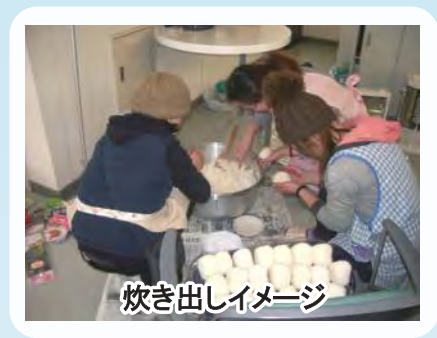
炊き出しイメージ