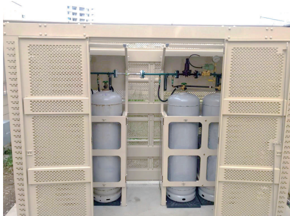
容器フェンスに収納