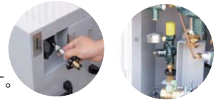
再液化防止用調整器(I-72)の収納スペースも設けております。

高圧ホースを接続したままケース内に収納が可能です。また、扉内部に取扱説明書収納部を設けています。